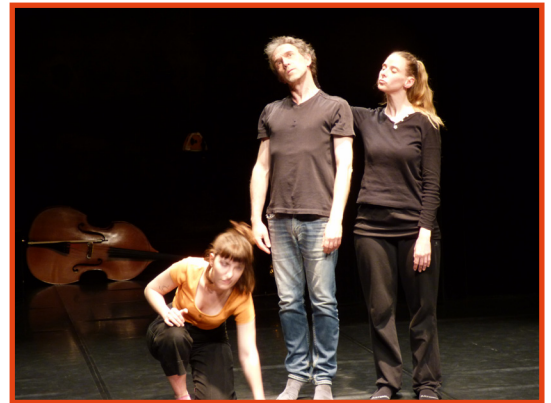
Le Grand Atelier

Un texte de Odin Leroux écrit à partir d'une idée originale : la conversation d'un personnage avec lui-même à trois âges différents, vingt, quarante, et soixante ans. Cette conversation éclectique parle de la vie avec l'expression de points de vue et de sensibilités différentes en fonction de l'âge mais aussi de l'état du monde à chaque âge du personnage.