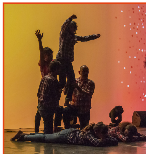
Sous la Peau © Michèle Colonna-Varenne

Au plateau, trois danseuses de la compagnie, un groupe d'adolescents, une grande caisse d'où sortent des personnages costumés de différentes époques.