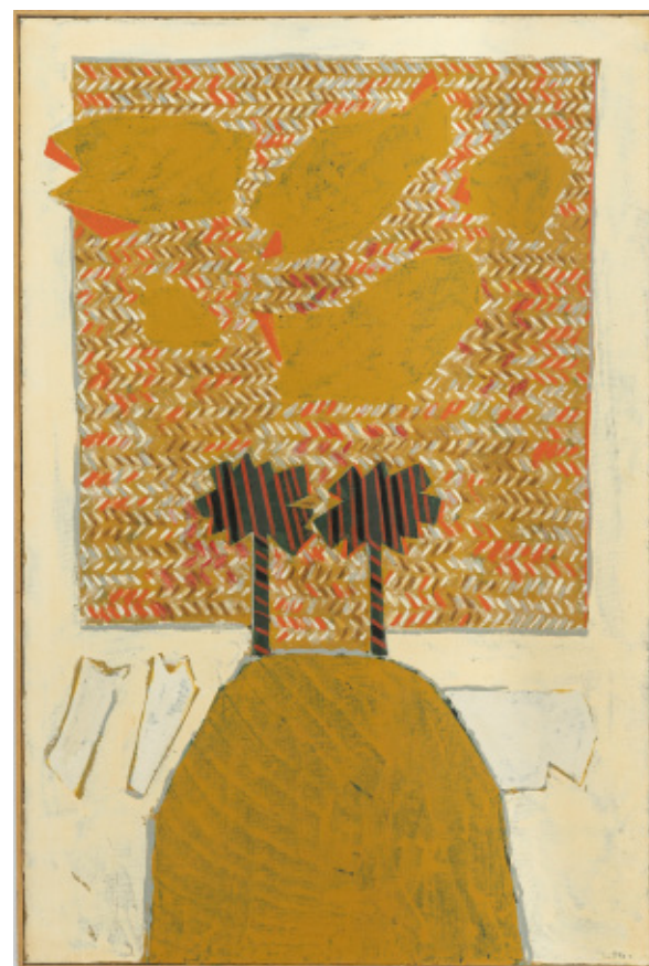
Un Ciel en chevrons ©Laurent Lagarde- Ville de Limoges / ADAGP, Paris, 2021.

Dans la même décennie, entre 1965 et 1969, l'artiste incorpore du sable dans ses tableaux et réinvente sa façon de peindre. Il utilisera ce matériau à de multiples reprises dans sa carrière, ces expérimentations lui permettant de renouveler son trait et la matérialité de ses toiles.