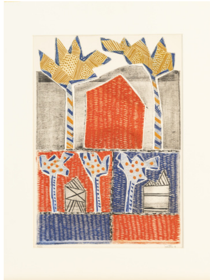
Le Chemin de la terre ©Laurent Lagarde- Ville de Limoges / ADAGP, Paris, 2021.

La sélection de gravures issues des collections du musée des Beaux-Arts de Limoges fait ici écho à deux de ses productions en céramique réalisées dans les années 1970 pour la Manufacture de Sèvres.