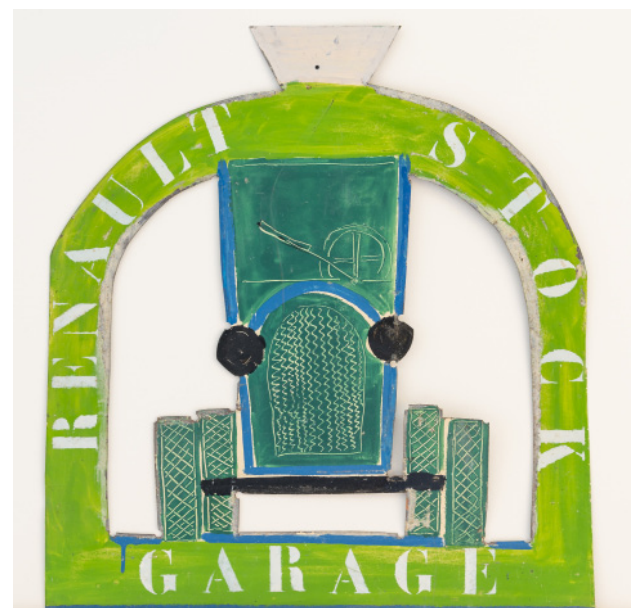
Garage Renault ©Laurent Lagarde- Ville de Limoges / ADAGP, Paris, 2021.