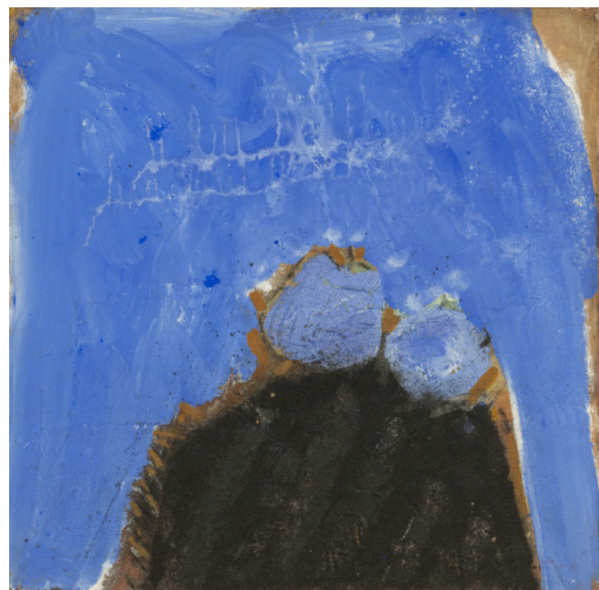
La Comédie des pommes ©Laurent Lagarde- Ville de Limoges / ADAGP, Paris, 2021.

La nature tient toujours une place centrale dans les compositions de l'artiste qui offre des paysages et des natures mortes aux formes majoritairement en phase avec une nature réenchântée.