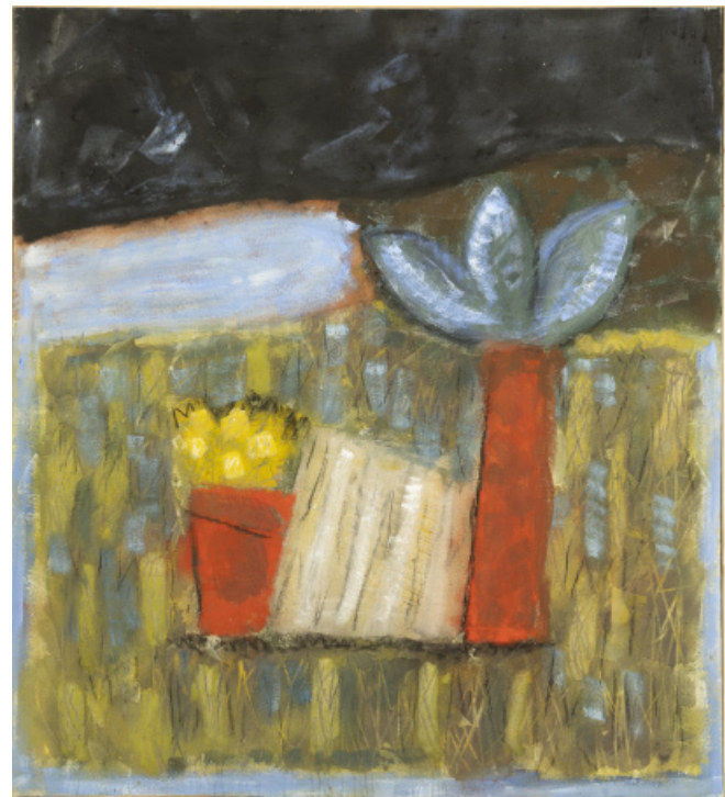
Arbre rouge et bleu

Durant deux années, l'artiste opère une brève incursion dans la peinture à l'huile pour réaliser une série de natures mortes, simples poteries disposées frontalement, qui possède la force plastique, la structure rigoureuse et la monumentalité de l'architecture.