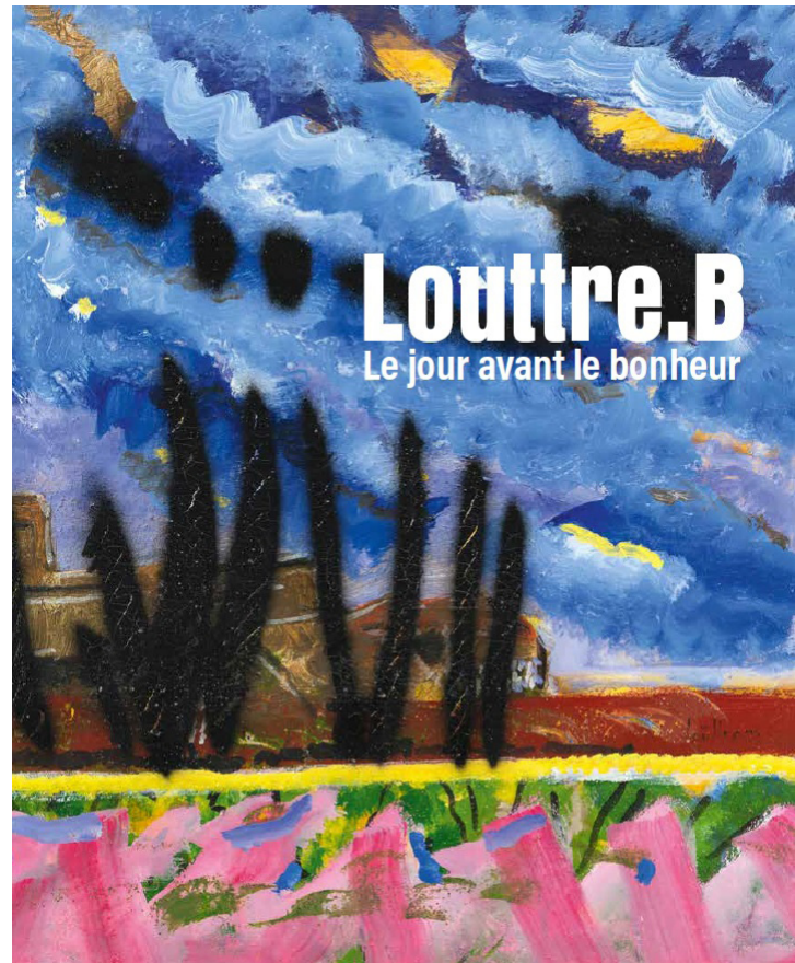
Couverture du catalogue Louttre.B - Le jour avant le bonheur

Un goût commun de « terriens ». Louttre.B et S. Gauthier, Sèvres et Limoges. Alain-Charles Dionnet