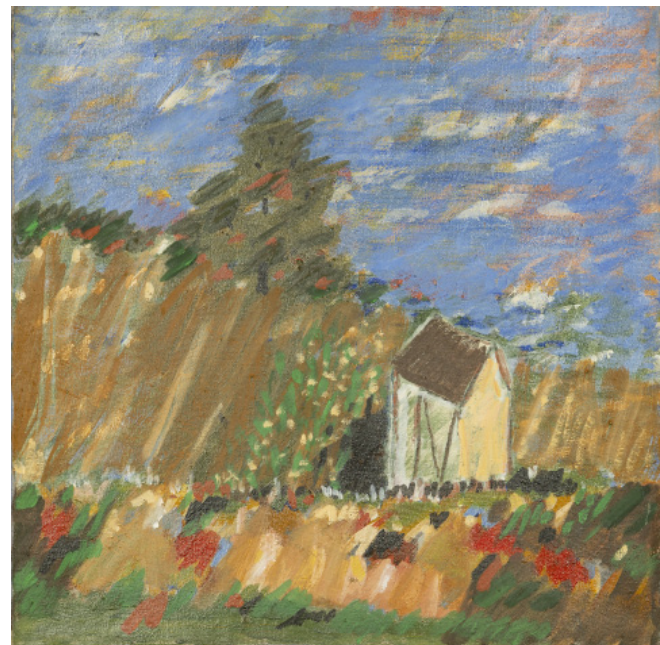
Sans cœur ©Laurent Lagarde- Ville de Limoges / ADAGP, Paris, 2021.

À la fin des années quatre-vingt, son travail évolue vers des plans superposés, imbriqués grâce à des bandes colorées. Sa recherche ne porte plus alors sur les éléments représentés, qui restent dans un répertoire identique : architectures simples et arbres inscrits dans un paysage, mais dans la matière même de la peinture. Le geste s'élargit, délaisse les aplats pour trouver la force et la vibration de la couleur par l'utilisation de hachures qui s'opposent ou se répondent afin de construire l'espace, presque toujours carré, de la toile.