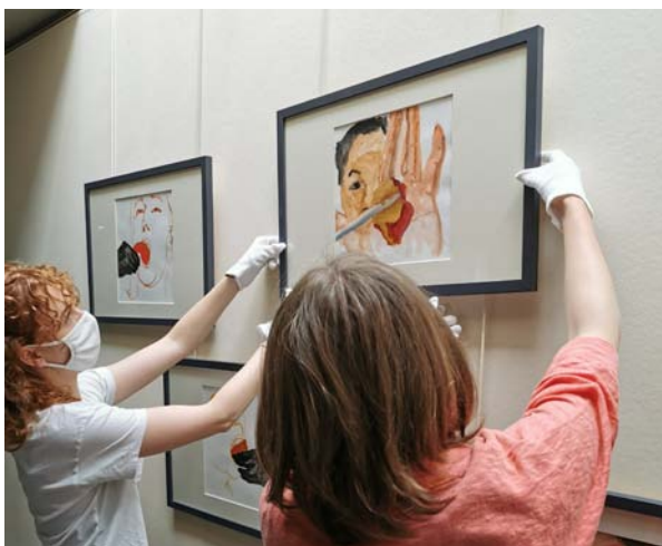
Accrochage de l'exposition « Essentiel / Non Essentiel »