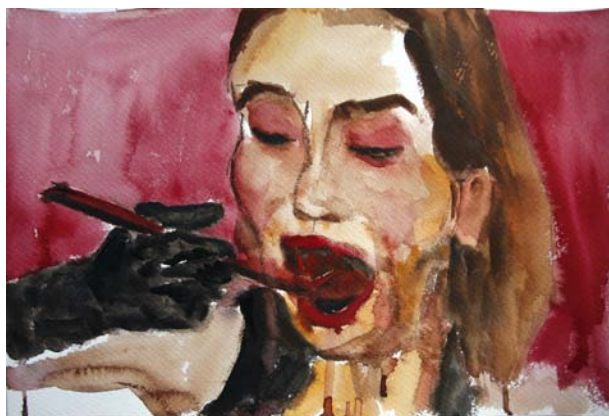
Ssoyoung, 2020 Aquarelle sur papier 30.5 x 45.5 cm © SHU Rui

Le but de ces vidéos est simple : manger devant la caméra et le partager avec le plus grand nombre possible. L'acte de manger est donc méticuleusement mis en scène : le goûteur est habillé, coiffé et maquillé ; les mouvements des muscles du visage et les textures sont mis en avant par l'image et le micro. Tout est étudié, de la lumière au son, pour vous faire vivre une expérience gustative unique par procuration. La quantité ingurgitée par ces goûteurs est également phénoménale, ce qui induit un sentiment de dégoût pour certains, mais peut aussi être perçue comme l'assouvissement d'un fantasme pour d'autres. À l'instar de la série Maquiller , les cadrages choisis par l'artiste sont déroutants. Ces scénettes agissent de fait comme une métaphore de nos sociétés occidentales consuméristes et opulentes mais soulignent également la solitude et le besoin de se connecter les uns aux autres, en regardant ici des inconnus manger. Bien qu'encore très peu étudié, un tel phénomène semblerait s'expliquer par le besoin des jeunes adultes d'échapper à leur anxiété et de se lier virtuellement. Des situations qui se retrouvent chez de nombreuses jeunes personnes à travers le monde.