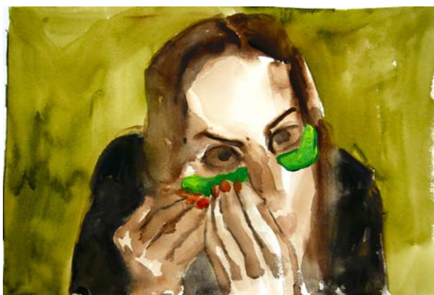
Elizabeth, 2020, Aquarelle et acrylique sur papier 30,5 x 45,5 cm © SHU Rui

Bien qu'habitée à peindre des portraits à partir de modèles vivants, SHU Rui s'est lancée, par la force des choses, dans le portrait à partir d'images issues de vidéos tutorielles. Elle poursuit sa pratique du portrait classique en adaptant ses cadrages et en capturant les moments spécifiques qui l'inspirent. Depuis quelques années, les plateformes d'hébergement de vidéos en continu voient déferler de nombreux tutoriels en tous genres, permettant aux néophytes d'acquérir des connaissances sur des sujets divers et variés. Consommant elle-même des vidéos sur le maquillage pour son plaisir, l'artiste a décidé de les prendre pour modèle de ses aquarelles. Si les cosmétiques sont standardisés, SHU Rui a découvert qu'il existait mille et une façons de se maquiller à travers le monde et d'utiliser ces produits. Ce qu'admire l'artiste dans ces vidéos, c'est la façon dont chaque « youtuber » parvient à réinventer l'utilisation des cosmétiques, parfois au-delà de leur utilisation première. Les portraits issus de cette série donnent ainsi à voir au spectateur une myriade de visages et de gros plans peu habituels. Si le visiteur peut se sentir dérouter par les sujets et les cadrages, il parvient difficilement à détacher le regard de ces petites scènes insolites.