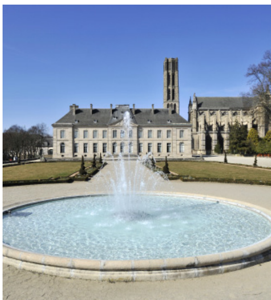
Musée des Beaux-Arts

Le musée des Beaux-Arts de Limoges, installé au pied de la cathédrale dans le quartier historique de la Cité, occupe depuis 1912 l'ancien palais épiscopal édifié à la fin du XVIII e siècle, situé au cœur de jardins dominant la vallée de la Vienne et classé Monument historique. Les collections sont réparties en quatre grands pôles : la collection d'Émail (XII e siècle à nos jours) assure la singularité et la renommée du musée ; les Beaux-Arts, avec des peintures de la Renaissance aux grands maîtres du XX e siècle ; une collection d'Antiquités égyptiennes riche de près de 2 000 pièces ; et enfin, l'Histoire de Limoges depuis sa création à l'époque gallo-romaine jusqu'au début du XX e siècle.