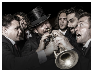
Hot Swing Sextet

A travers 37 disciplines musicales enseignées, le Conservatoire offre un apprentissage et une formation au service tant des amateurs investis et motivés que de futurs professionnels : piano, percussion, trompette et même saxophone avec une formation pour adultes. Bref, tous les instruments qui font la renommée du jazz.