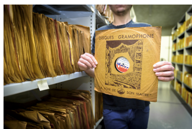
Le fond est stocké dans les sous-sols de la Bfm de Limoges

Parcourez l'un des plus beaux ensemble dédié au jazz à l'échelle européenne.