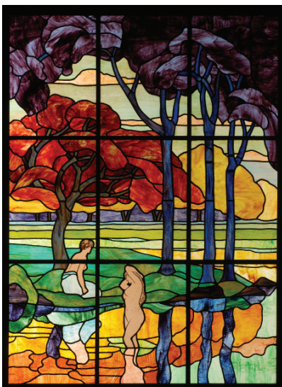
Francis Chigot et Léon Jouhaud, Les Baigneuses , avant 1920, verres et plomb, 178 x 129,5 cm, Limoges, musée des Beaux-Arts, inv. 2022.0.5