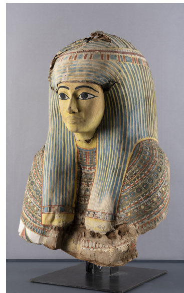
Enveloppe de momie, inv. 2003.24.1

Pour la première fois, historiens et égyptologues ont étudié l'ensemble des œuvres du musée permettant au visiteur de mieux comprendre cette collection unique. Le parcours présentera les œuvres phares de la collection mais aussi de nombreuses œuvres inédites provenant d'institutions publiques (musées royaux d'art et d'histoire de Bruxelles, musée du Louvre), de collections privées et des réserves du musée.