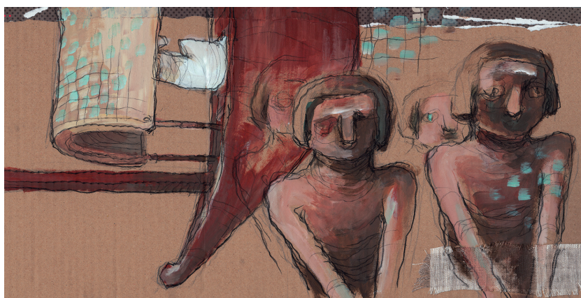
Maîtres de vie © Thomas Duranteau

Exposition d'aquarelles et collages inspirés des œuvres de la collection d'antiquités égyptiennes du musée par Thomas Duranteau, artiste, auteur et historien ; exposition dans la galerie de liaison du musée.