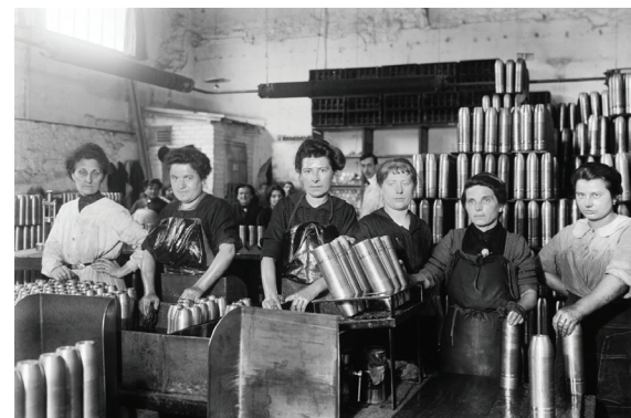
Munitionnettes. Des ouvrières sur une chaîne de fabrication d'obus dans une usine de munition.