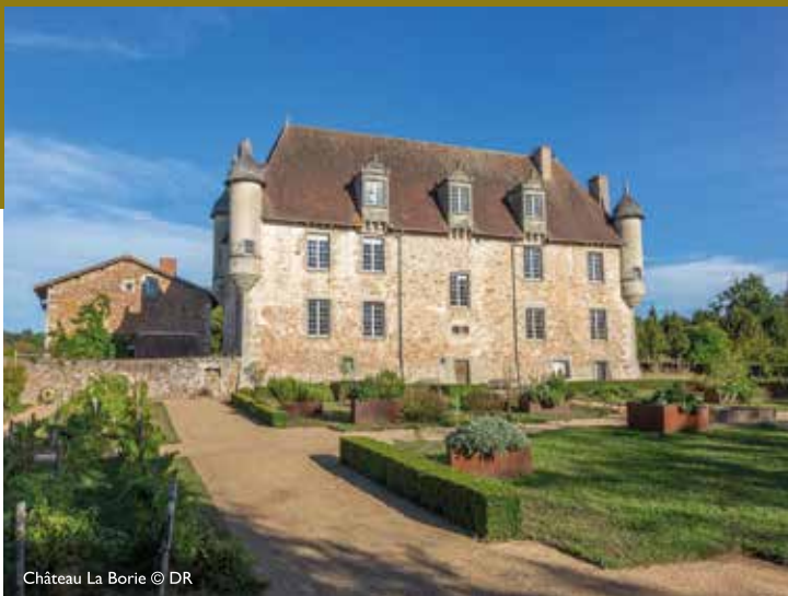
Château La Borie