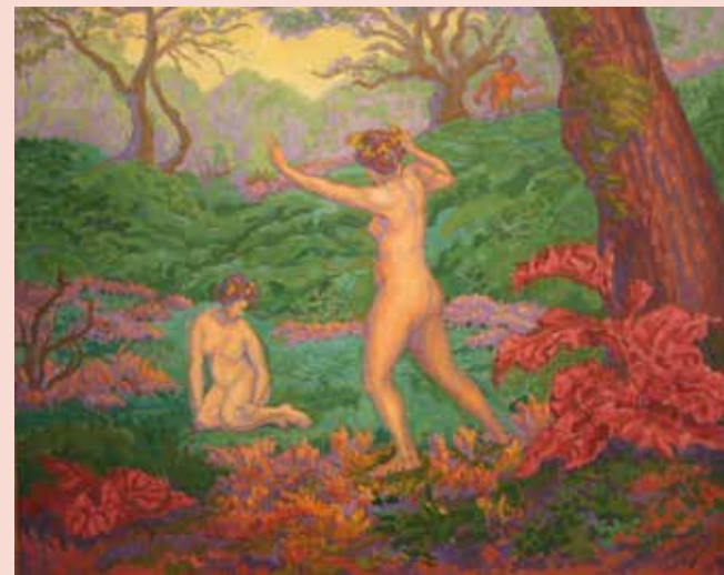
Paul Elie Ranson. Le Faune et le Printemps, 1895

En ce premier avril, découvrez nos sirènes, visibles dans les collections sur l'histoire de Limoges. Ce relief sculpté provient de l'abbaye Sainte-Marie-de-la-Règle, fondée au IX e siècle, reconstruite au début du XII e , vendue en 1798 et démolie avant 1817.