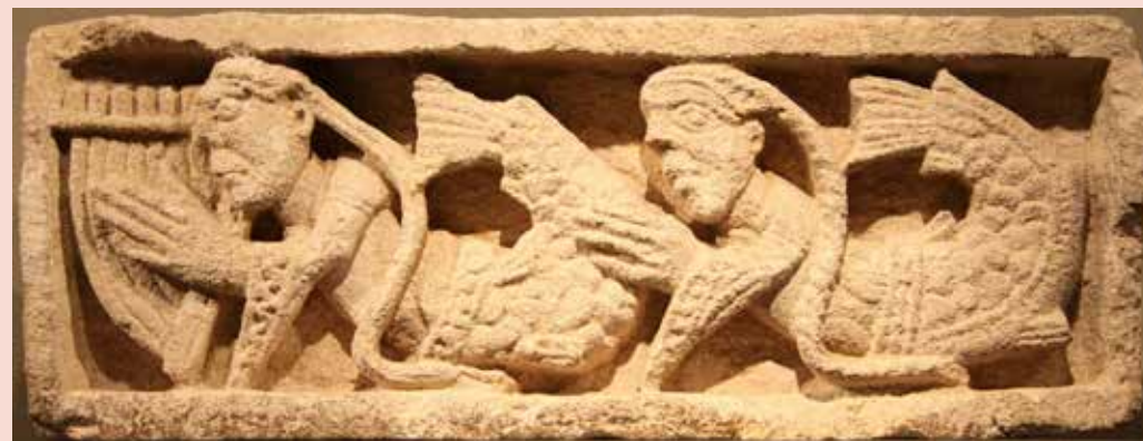
Sirènes musiciennes. Entre 1105-1130. Calcaire. 20 x 54 x 17 cm Cl. MH 28.07.1928 Inv. 2010.D12.2

Achat du musée avec l'aide du FRAM, 2018