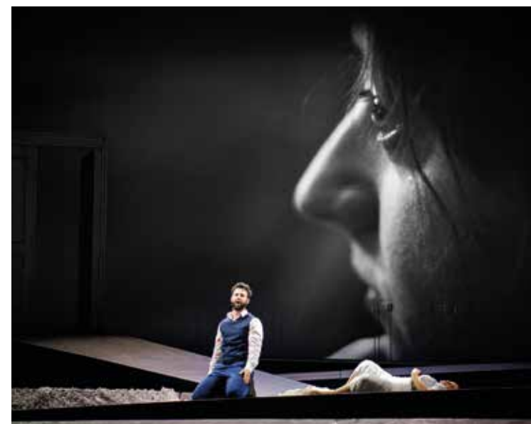
générale Rusalka

Avril : Les Sept dernières paroles du Christ , de Theodore Dubois, dans sa version originelle de 1867 pour petit orchestre, orgue, chœur et solistes avec le Chœur et l'Orchestre de l'Opéra de Limoges sera enregistré à huis-clos puis diffusé très prochainement sur les réseaux numériques habituels de l'Opéra (Youtube et Facebook).