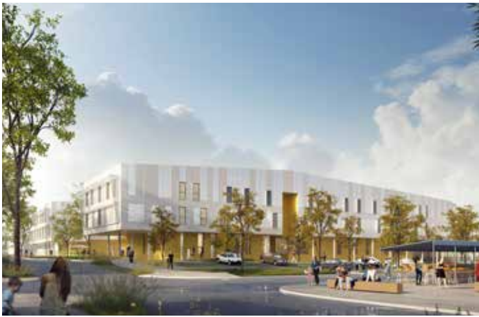
Le futur EHPAD Marcel-Faure à La Bastide

2016 a également vu le développement du nouveau schéma d'organisation de la santé – sécurité au travail avec la mise en place de 102 assistants de prévention. Il est basé sur une nouvelle méthode : l'Analyse Préliminaire des Risques, qui vise à produire une évaluation a priori des risques, fonction de la détermination de la vraisemblance d'occurrence d'un évènement non souhaité. Une formation organisée par le CNFPT s'est tenue en octobre 2016 et se poursuivra en 2017.