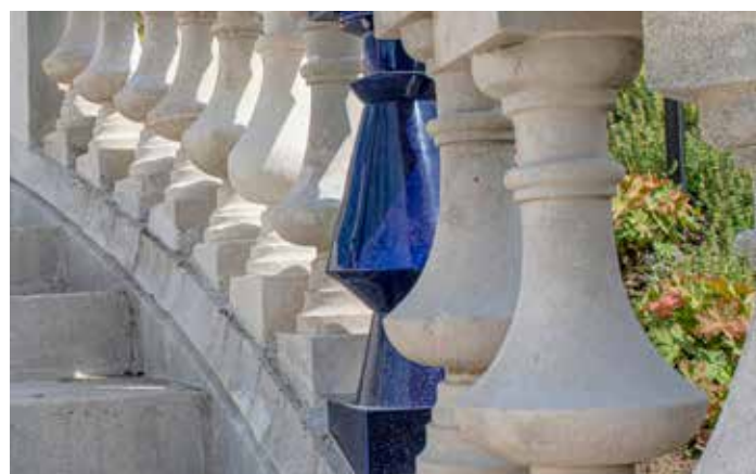
Pièce en céramique posée dans l'escalier du Jardin d'Orsay