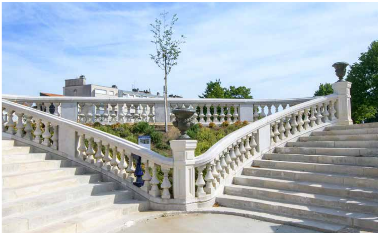
Escalier monumental du Jardin d'Orsay

Santé et développement durable : Le développement des conditions du bien-être dans une ville verte, d'art et de culture, pour les limougeaux, séduira également les touristes.