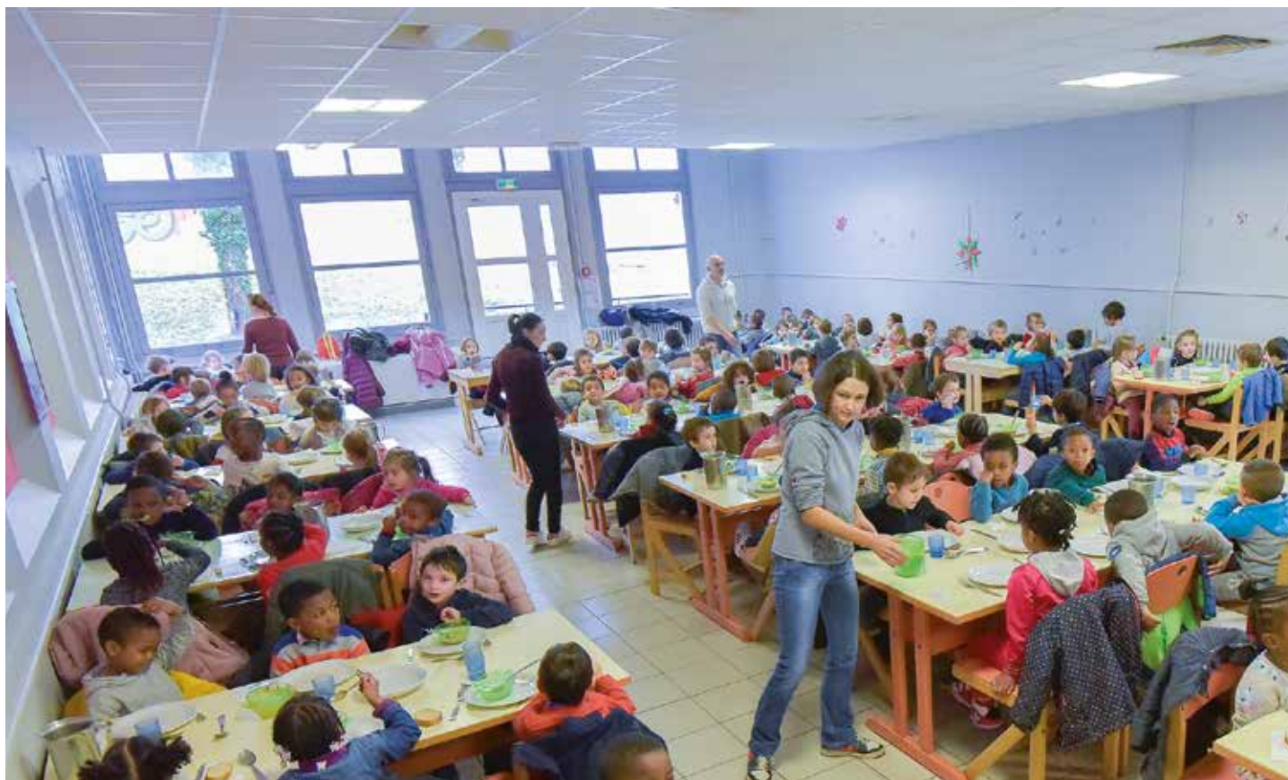
Moins de sel dans les assiettes au restaurant scolaire

Les achats locaux issus de productions régionales ont aussi été augmentés.