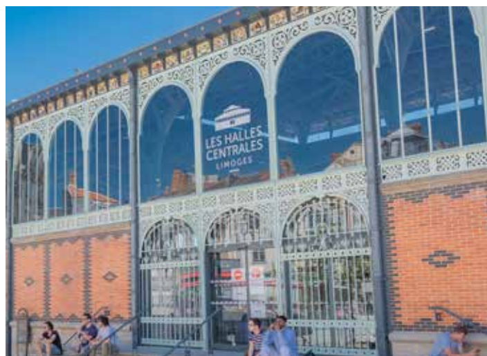
Halles centrales rénovées

Limoges compte toujours neuf marchés de plein-air organisés sur l'ensemble des quartiers de la ville ainsi que deux halles (centrales et Carnot) qui favorisent les circuits courts et la vente directe.