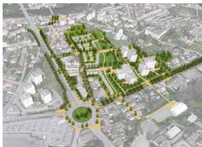
Écoquartier des Portes-Ferrées

Les partenaires du projet (Limoges Métropole, Limoges habitat, l'État, Noalis (ex Dom'aulim) sont associés à cette mission.