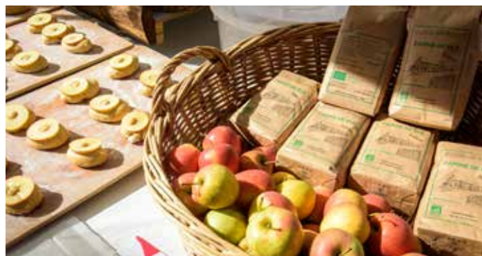
Marché du goût