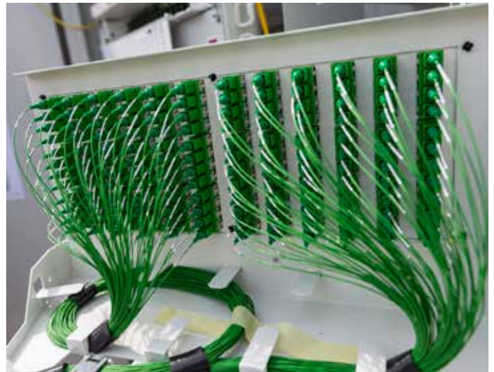
Déploiement de la fibre optique chez l'utilisateur

Fin 2019, 100% des logements (soit 95 544) sont adresses, c'est-à-dire qu'il existe une armoire de raccordement à proximité ; 70% des logements (soit 66 880) sont éligibles.