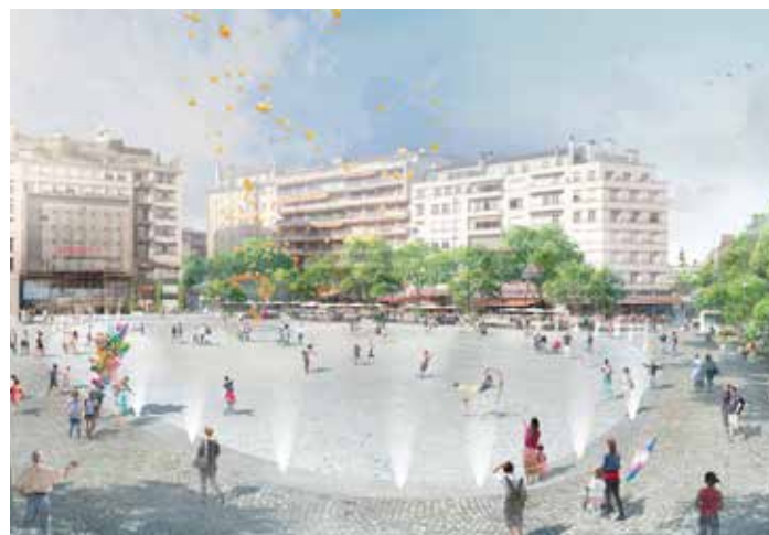
La place de la République

Par ailleurs, les dispositifs de brumisation sur le plateau événementiel de la place ont également été intégrés dans la dalle ; ils permettront un rafraîchissement de la place en été.