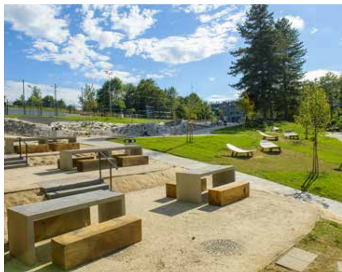
Espace de pique-nique et de détente au Parc des Étoiles