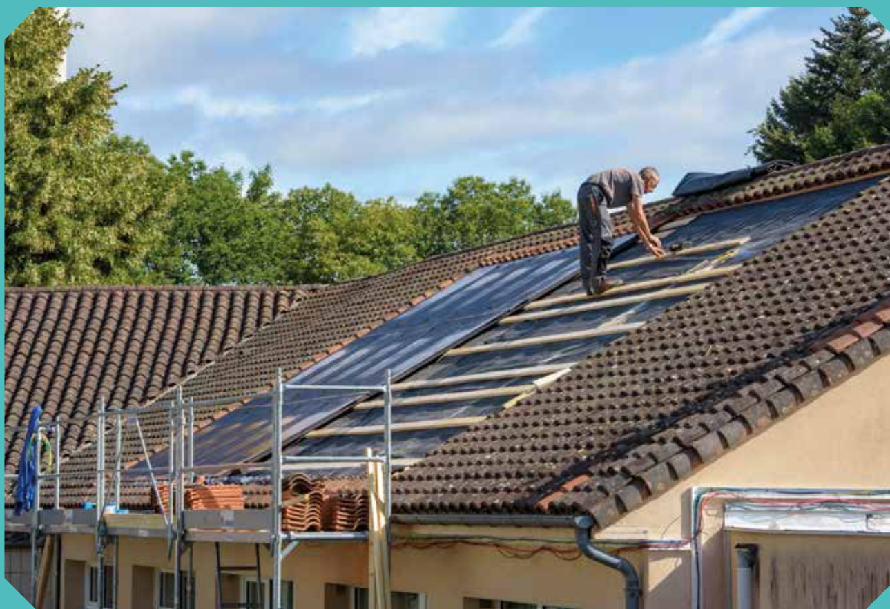
Pose de panneaux photovoltaïques sur la toiture de l'école primaire de Beaune-les-Mines