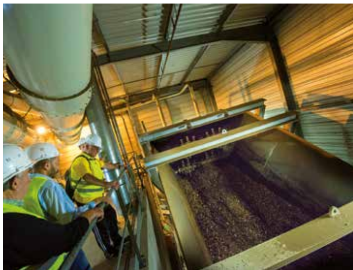
Chaufferie biomasse du Val de l'Aurence