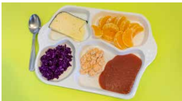
Présentation assiette sans perturbateurs endocriniens crèche Jean-Dufour

En tant que Ville-Créative, Limoges a notamment été plébiscitée pour la réalisation de plateaux en porcelaine destinés aux crèches. Ainsi, alliant santé et innovation, la commune contribue au développement économique du territoire.