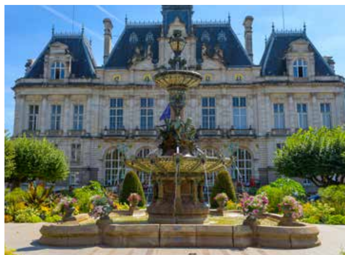
L'hôtel de ville

Les travaux sur la façade ouest ont démarré en 2020.