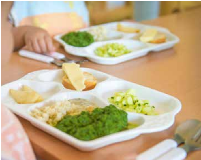
Plateaux-repas en porcelaine (sans perturbateurs endocriniens) utilisés dans les crèches

Enfin, à l'occasion de la relance de ses marchés de fourniture en denrées alimentaires, cinq lots ont été réservés à l'agriculture biologique et trois lots recherchant spécifiquement une haute performance en matière d'approvisionnement direct auprès d'agriculteurs.